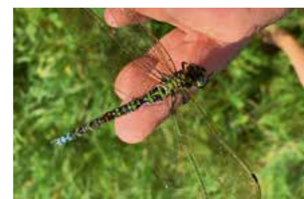
Vorsichtig wurde eine blau-grüne Mosaikjungfer betrachtet