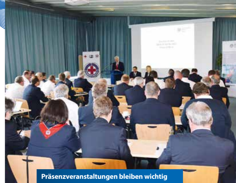
Präsenzveranstaltungen bleiben wichtig