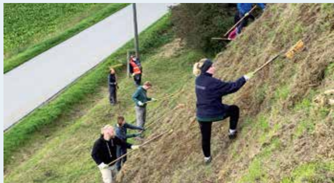
In manchen Bereichen ist ein aufrechter Gang nicht mehr möglich, da braucht man den Rechen auch als Steighilfe