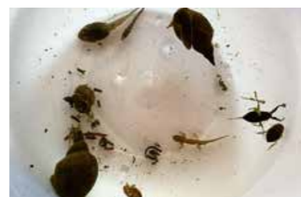
Es ging allerhand ins Netz, Spitzschlamm-schnecken, dreistachelige Stichlinge, Wasserskorpione, Gelbrandkäfer, Teichmolche und Kaulquappen der Knoblauchkröte