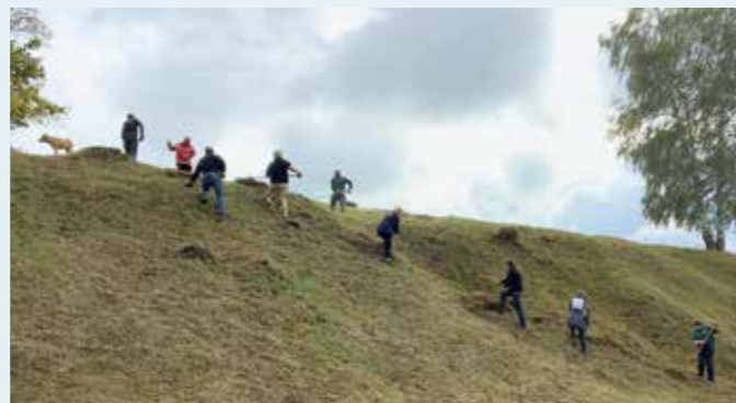
im Steilhang war Teamarbeit gefragt, doch durch die langen Rechenstiele war der Corona Abstand stets gegeben