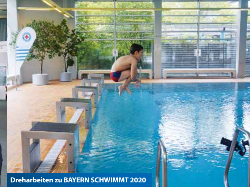
Drehtarbeiten zu BAYERN SCHWIMMT 2020